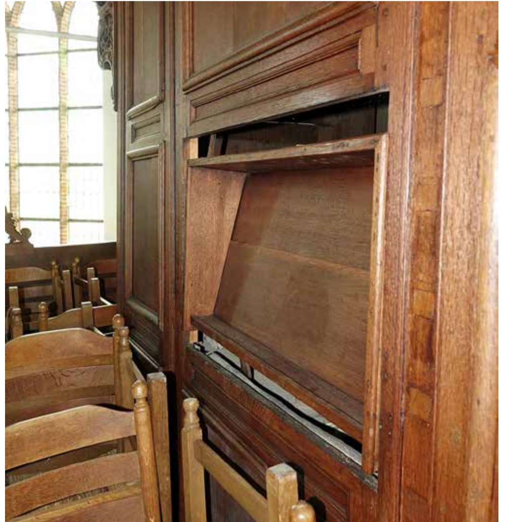
De plaats van de voormalige klaviatuur.