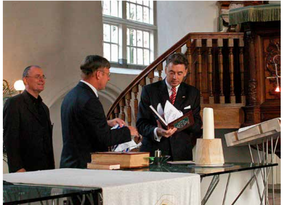
Overhandiging van het eerste exemplaar van het jubileumboek 'Vijf eeuwen Friese orgelbouw' aan Commissaris der Koningin Ed Nijpels in 2004.