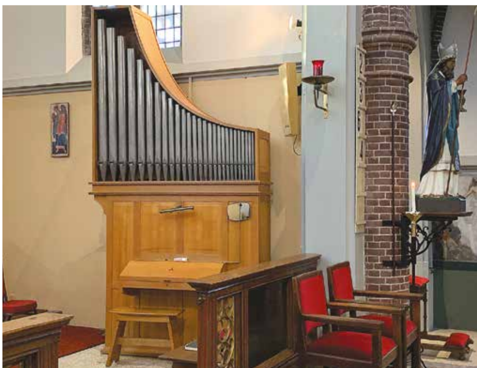
Het koororgel van Klaus Becker in de Ludgeruskerk van Balk, situatie januari 2024.

In de kerkbestuursvergadering van 10 maart 2003 merkt pastor Mulder op het jammer te vinden niet betrokken te zijn bij het aankoopbesluit. Op de volgende vergadering van het kerkbestuur wordt het besluit tot aankoop echter uitdrukkelijk bevestigd.