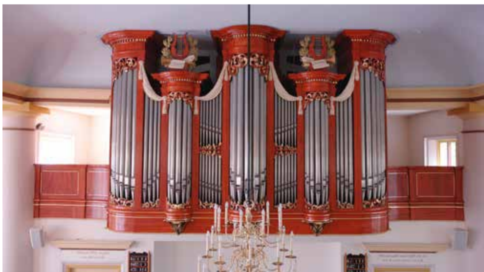
Het Bakker & Timmenga-orgel (1938) in de Karmel te Woudsend.