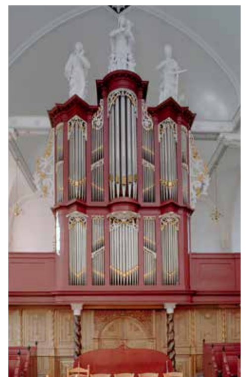
Het Van Gruisen-orgel (1840) in de Nicolaaskerk te Nijland.