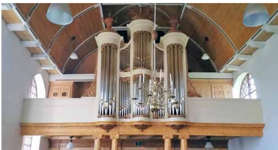
Het Van Dam-orgel (1844) in Bordenakerk te Vrouwenparochie.