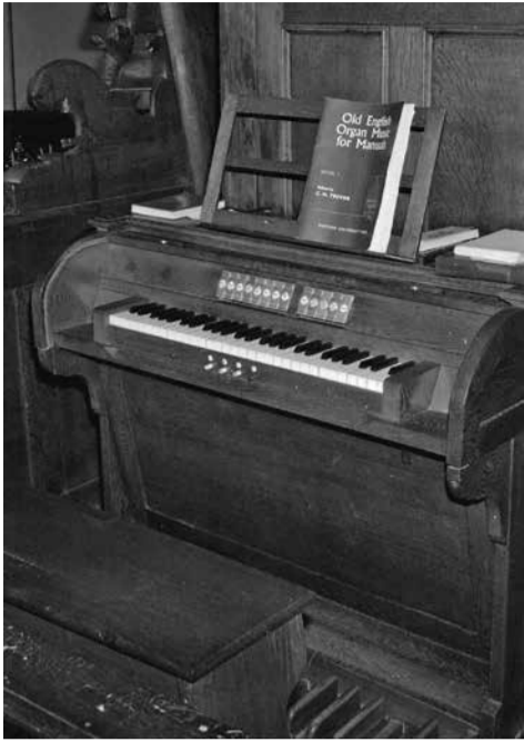
De speeltafel uit 1928.