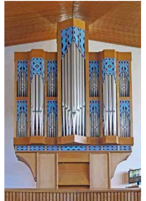
De avontuurlijke orgelkas (1973) in de Kurioskerk te Leeuwarden.

Gaandeweg kwam binnen het bedrijf het accent steeds meer op restauratie te liggen. In 1982 kwam met de voltooiing van een orgel voor de Hervormde Kerk van Surhuisterveen een einde aan de reeks door de firma gebouwde nieuwe orgels. Dit fraaie instrument bewijst dat de stijlmogelijkheid van neobarokke