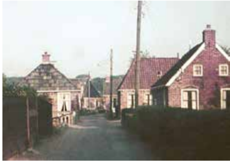
De kleine arbeiderswoning aan De Steeg in Driezum, waar Gjelt Visser werd geboren.

Wie is deze Gjelt Visser? Hierna volgt een portret.