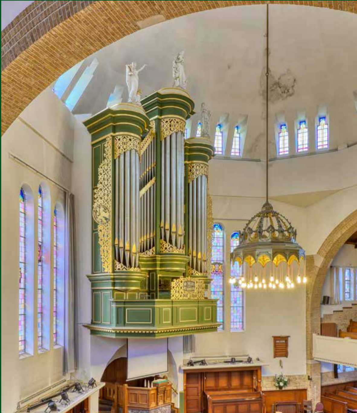
Het Vermeulen-orgel (1935/1978) in de Koepelkerk te Leeuwarden.