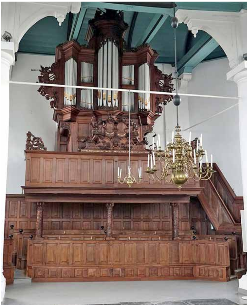
De orgelkas in Sint Annaparochie.

“krijschend en gillend, als zongen ze een klaaglied over de verwoesting die hier over alles is gegaan”