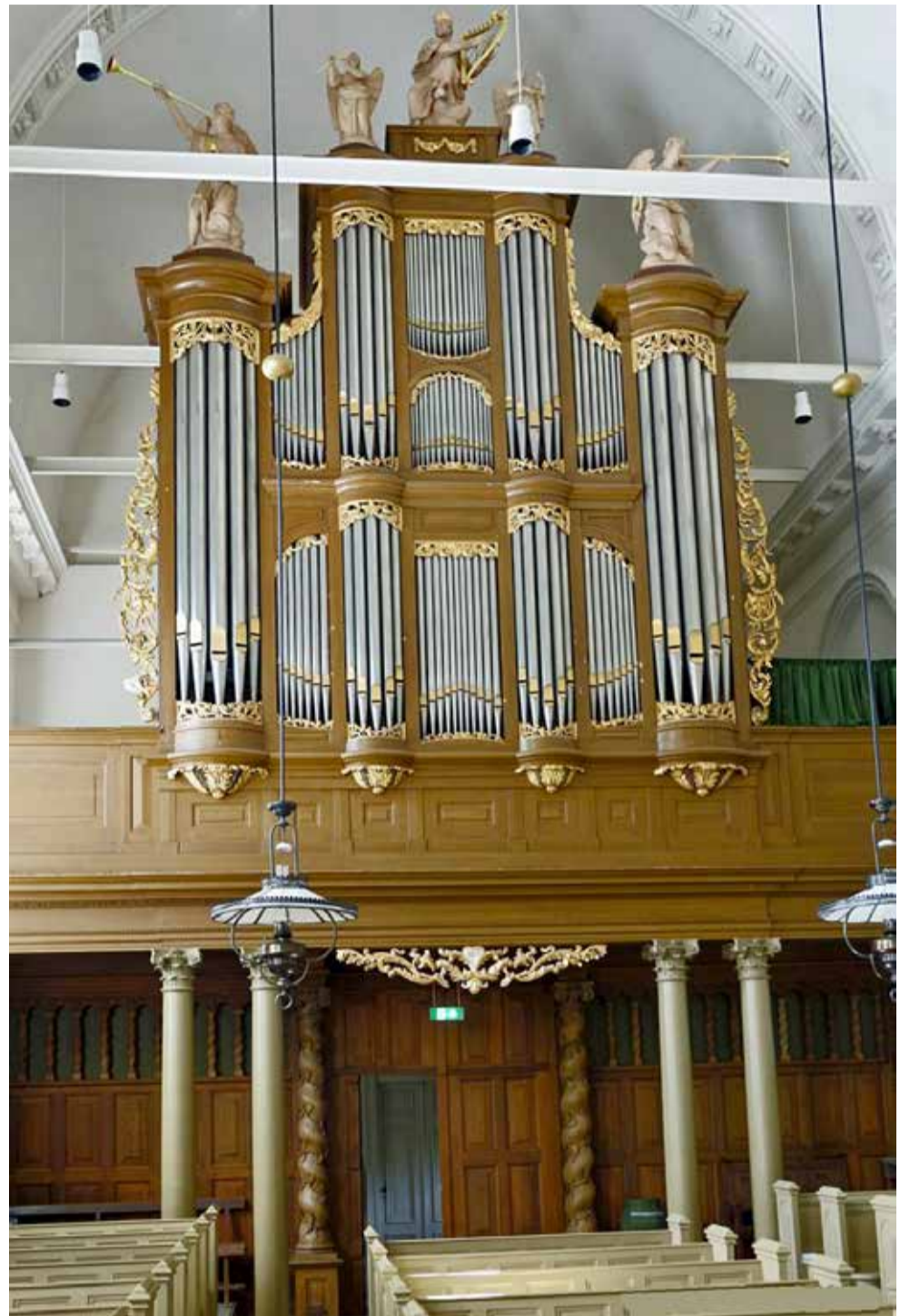
Het Hardorff-orgel (1861) in Menaam.