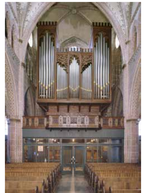
Het Maarschalkerweerd-orgel (1891) in de Sint-Martinuskerk te Sneek.