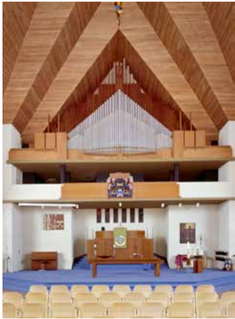
Het prachtige ensemble van kerk, preekstoel en orgel in de Pelikaankerk.