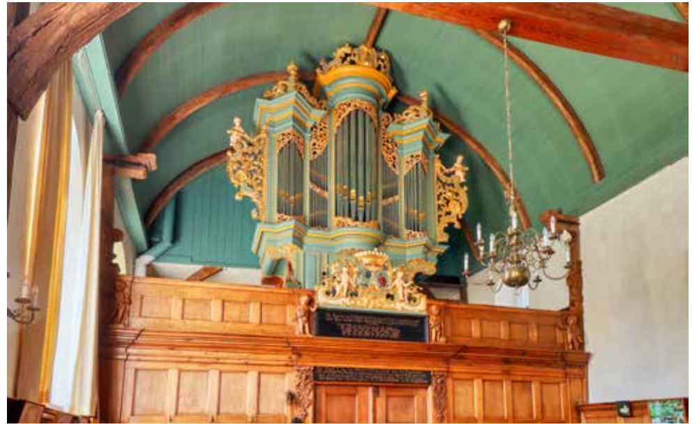
Het Schwartzburg-orgel (1735) in Burgwerd.