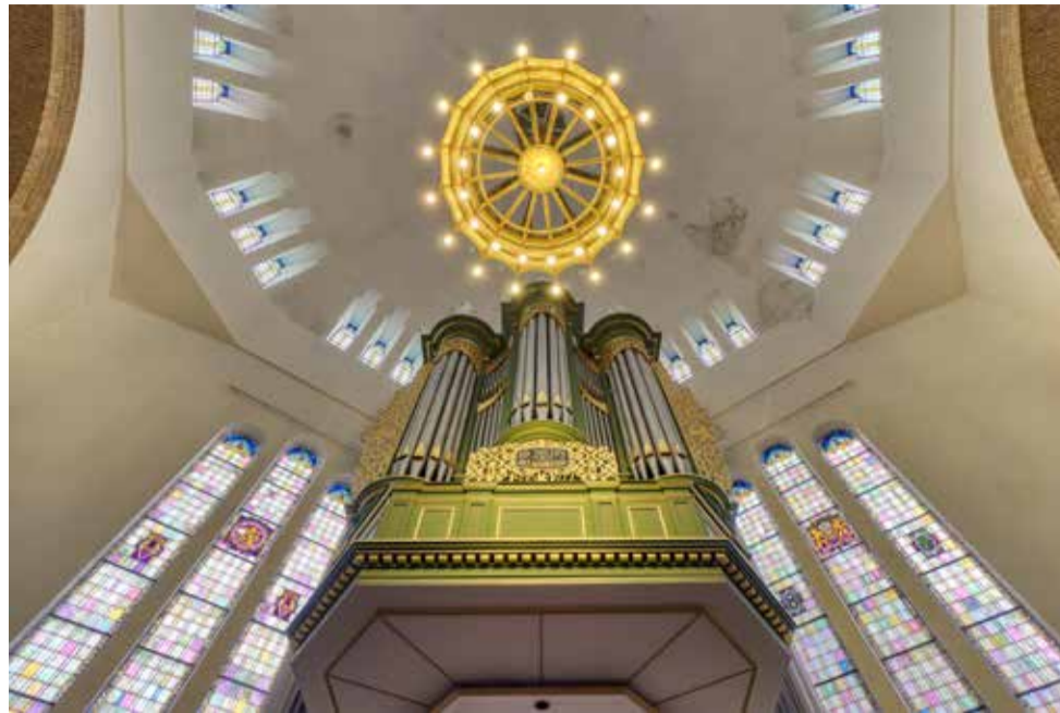
Het Vermeulen-orgel (1935/1978) in de Koepelkerk te Leeuwarden.

Het Koepeltheater, voorheen de Koepelkerk, is door haar Byzantijnse uitstraling een bijzonder gebouw in Leeuwarden. De Koepelkerk werd in 1923 als gereformeerde kerk gebouwd naar een ontwerp van de architect Tjeerd Kuipers. De bouw van de Koepelkerk was een gedurfd ontwerp en verbaasde menigeen. De toegepaste stijl is een mengeling van art deco en Byzantijnse architectuur. Het kerkgebouw heeft een vijfzijdige plattegrond. De grote met koper bedekte koepel is tienzijdig. Door het ontwerp met drie vleugels is op een kleine ruimte een groot gebouw gerealiseerd met 1100 zitplaatsen. Zowel in- als uitwendig is de kerk in hoge mate ongewijzigd. De kroonluchter valt op door de vorm van een koningskroon, dit vanwege het feit dat in 1923 het 25-jarig regeringsjubileum was van koningin Wilhelmina. De tienzijdige koepel heeft afwisselend korte en lange zijden, die respectievelijk drie en vier vensters hebben. De twee wanden ter weerszijden van het liturgisch centrum hebben elk drie