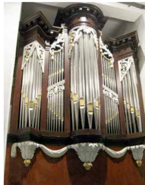
Het Albertus van Gruisen-orgel (1811) in de Sint-Michaëlkerk te Woudsend.

Manuaal (C-f3): Prestant 8', Viool di Gambe 8' discant, Holpijp 8', Octaaf 4', Quint 3', Flûte d'Amour 4', Octaaf 2', Tertiaan 1 3 / 5 , Mixtuur III-IV sterk