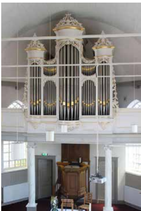
Links het Adema-orgel (1872) in de doopsgezinde kerk in Grou en rechts het Bakker & Timmenga-orgel in Westernijtsjerk. Het front is duidelijk beïnvloed door Adema.