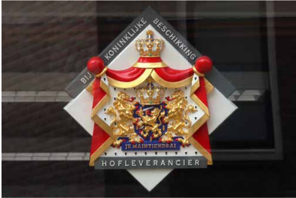
Het wapenschild ten teken dat Bakker & Timmenga zich hofleverancier mag noemen.

Het afgelopen jaar werd bekendgemaakt dat er helaas een einde is gekomen aan de firma Bakker & Timmenga, een orgelmakerij die van 1880 tot 2023 in Leeuwarden gevestigd was en een bedrijf dat vooral in onze provincie, maar ook daarbuiten, tientallen nieuwe orgels bouwde, restaureerde en onderhield. Kwaliteit heeft bij de firma altijd hoog in het vaandel gestaan. Sinds december 2005 droeg zij het predicaat 'Hofleverancier'.