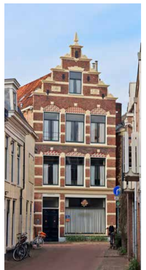
Het pand met de werkplaats in Kleine Kerkstraat te Leeuwarden.