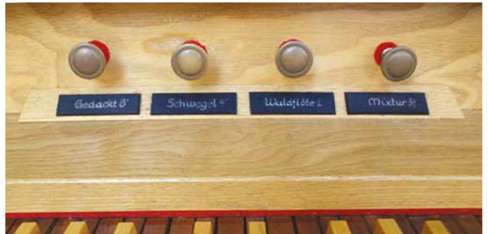
Registernamen en -knoppen van het Klaus Becker-orgel. V.l.n.r.: Gedackt 8', Schwegel 4', Waldflöte 2' en Mixtur 3f(ach).