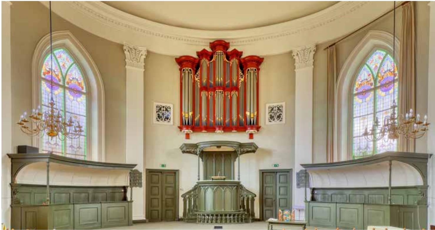
Het Scheuer-orgel (1847) in de Doopsgezinde Kerk te Sneek dat verloren dreigt te gaan.