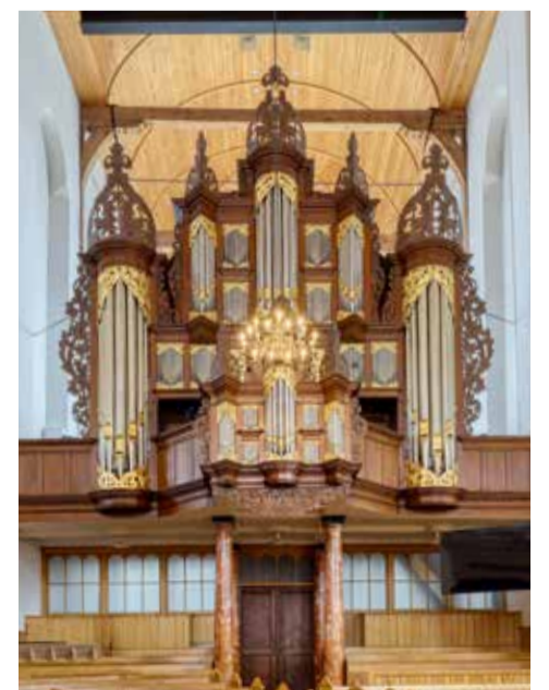
Het Schnitger/Van Dam-orgel (1711/1898) in de Martinikerk te Sneek.

Bijzonder is het carillon van de Martinikerk. Het is het omvangrijkste van Friesland, meer dan 4 octaven. De geschiedenis van het carillon gaat terug tot de tweede helft van de 16e eeuw. Toen hing er in een dakruiter op de Martinikerk een kleine voorslag, die automatisch door middel van een speeltrommel de uurslag aankondigde. Deze voorslag bestond uit negen klokjes. Rond 1712 werden het veertien klokken, in 1771 zesentwintig, nu in een koepel op de kerk, in 1955 drie octaven en in 1970 vier octaven. In 1998 vond er een uitgebreide renovatie plaats, waarbij de beiaard met 1 basklok en twee kleine discantklokjes werd uitgebreid tot 50 klokken.