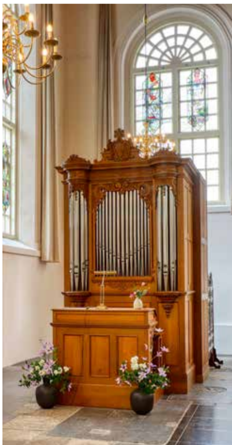
Het Van den Heuvel-koororgel.

In 2011 is door dezelfde firma groot onderhoud aan het orgel gepleegd, waarbij onder andere de oude discant van de Prestant 8' weer opnieuw is aangesloten. Dit register is momenteel één van de weinige origineel bewaard gebleven frontprestanten van Arp Schnitger! Verspreid over 11 registers bleven ongeveer 550 pijpen van Schnitger bewaard waaronder bijna alle frontpijpen.