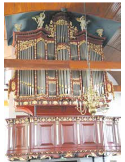
Hervormde kerk Numansdorp Restauratie en uitbreiding 2018

Vreeweg 49 8071 SJ Nunspeet Tel. 0341 25 24 84 www.hendriksen-reitsma.nl info@hendriksen-reitsma.nl