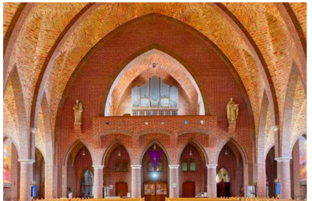
Het Adema-orgel (1866) in de Sint-Dominicuskerk te Leeuwarden.