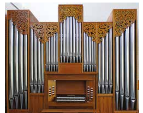
Front van het Van Leeuwen-orgel (1954) uit de in 2020 gesloten GKv van Dokkum.