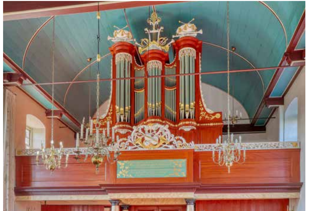
Het Van Dam-orgel (1823) in de Dorpskerk van Ingwierrum.

We rijden verder op Holwert aan. De kerk valt met een hoge spitse toren en een hoekige vorm op. Achter het hoge front bevindt zich een Scheuer-orgel (1852). Bij Holwert hebben we de keuze rechtsaf richting Dokkum