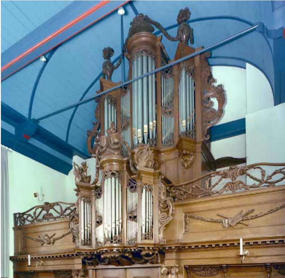
Het Van Dam-orgel (1784) in Langweer.

De Voorjaarsexcursie brengt ons naar de gemeente De Fryske Marren waar we Langweer, Sint Nicolaasga en Lemmer bezoeken. Naast orgels uit de 18e en 19e eeuw horen we tijdens deze excursie ook een orgel uit de tweede helft van de 20e eeuw.