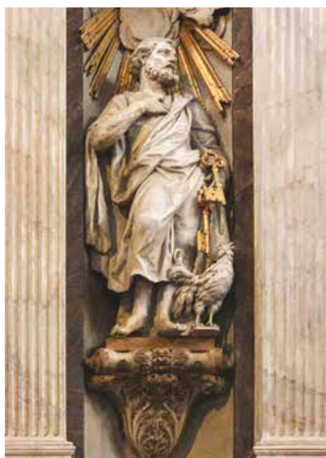
Beeld van Petrus met de sleutels van hemel en aarde in de altaarwand van de oud-katholieke Paradijskerk te Rotterdam; vervaardigd tussen 1720 en 1725 door de Vlaamse beeldsnijder Alexander Dominicus Pluskens en zijn medewerkers.

- Protestanten zal de opbouw van de oud-katholieke viering direct opvallen plus de centrale plek van de communie daarin. En voorts de gewaden; het zitten, staan en knielen; wisselzangen van priester, cantors en gemeente; de vredegroet; de wierook en het geklingel van belletjes. Voorganger is een priester. Dit oogt nogal rooms-katholiek, maar de gemeente zingt meer en ook de preek klinkt meer protestants.