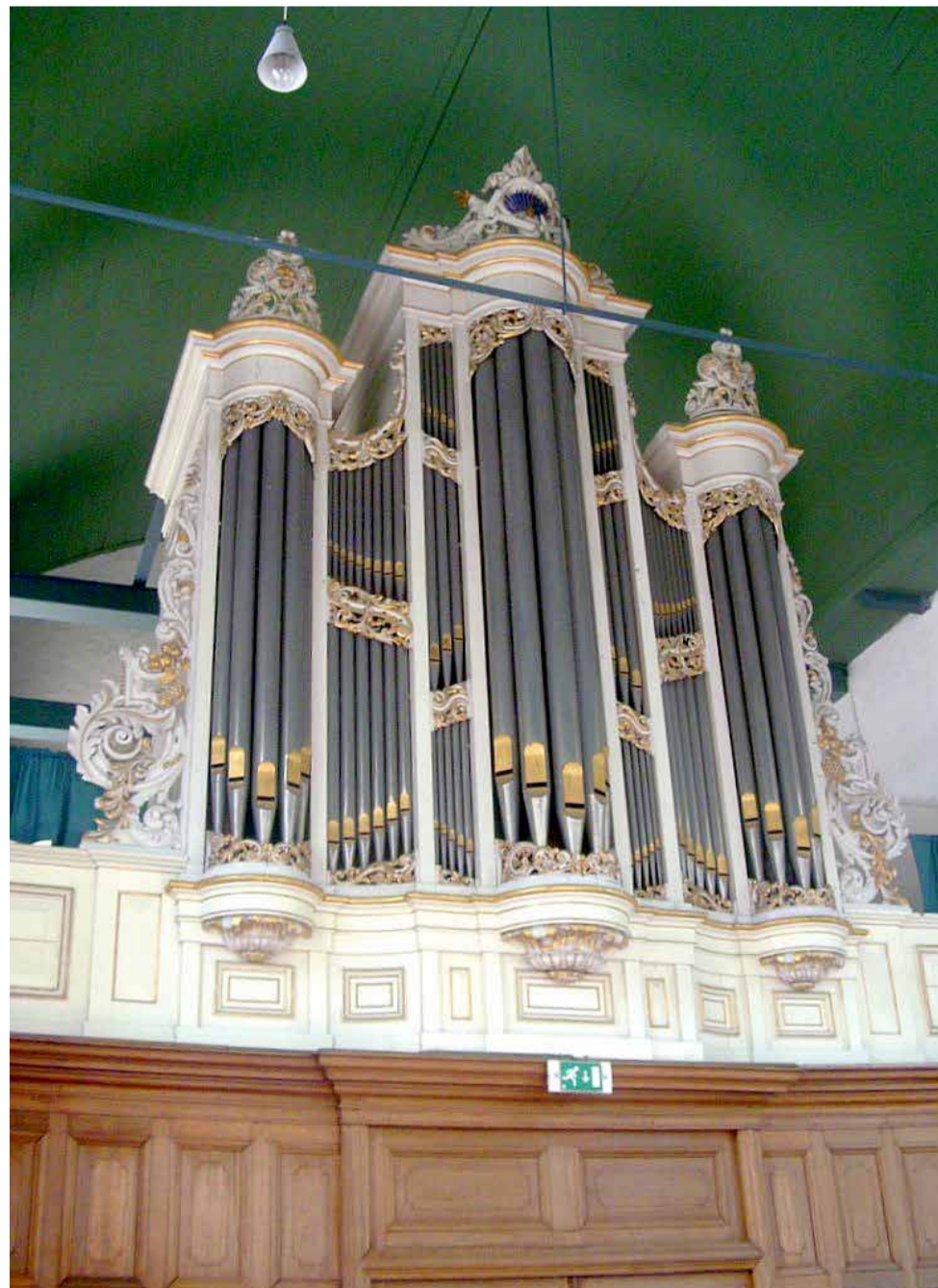
Het Van Dam-orgel (1870) in de Nicolaaskerk van Blije.