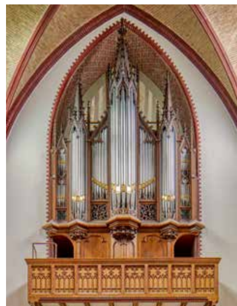
Het Lodewijk Ypma-orgel (1871) in de Sint-Nicolaaskerk.

Het Papageno Huis Fryslân is een bijzonder project in het centrum van Lemmer waarin zorg, cultuur en erfgoed samenkomen. Het huis is gevestigd in de neogotische, voormalige Gereformeerde Kerk uit 1889, die na een grondige restauratie een nieuwe maatschappelijke functie heeft gekregen. In mei 2023 opende het Papageno Huis officieel zijn deuren. Het initiatief maakt deel uit van de Stich-