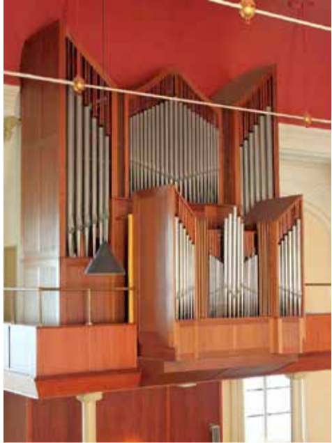
Het Fonteijn & Gaal-orgel (1962) in het Papageno Huis.