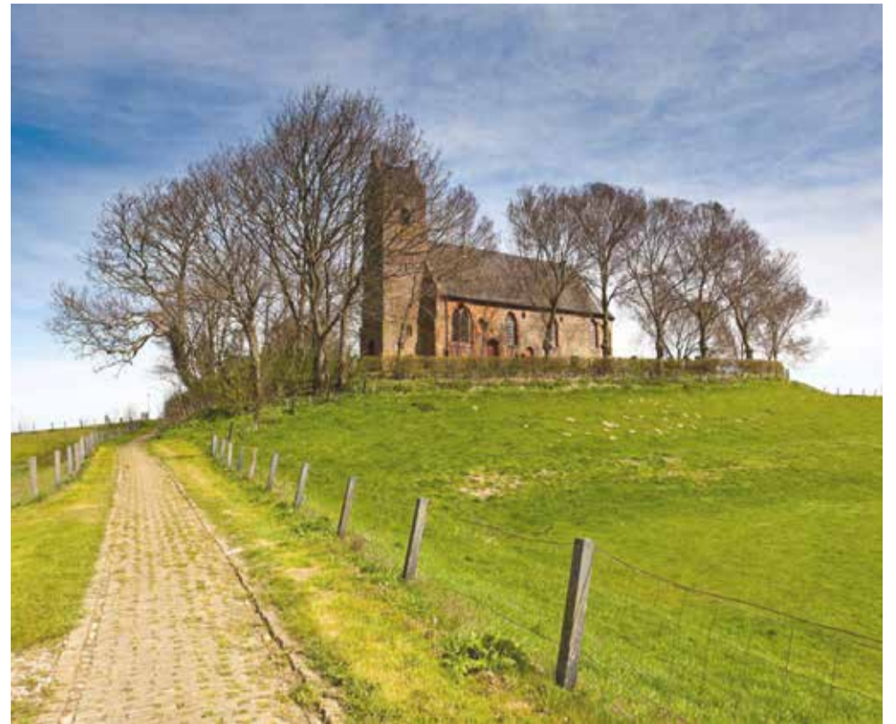
De Hervormde Kerk van Hegebeintum op de hoogste terp van Nederland.

Al een paar jaar organiseren we in samenwerking met Stichting Alde Fryske Tsjerken op Openmonumentendag 's middags een