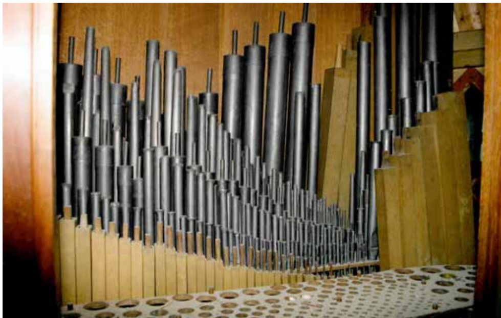
Een blik in het orgel vóór de restauratie.