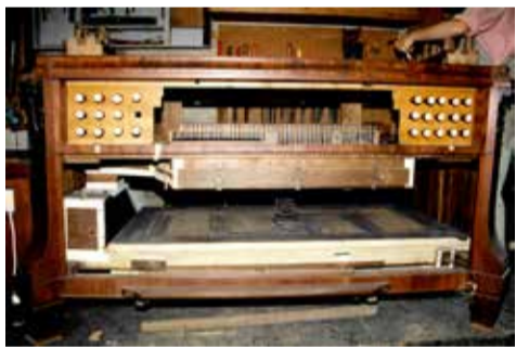
De klaviatuur vóór de restauratie.

Ten slotte werden en worden soms orgels binnen een kerkgebouw verplaatst. Dat gebeurde met het orgel van Stiens (gebouwd in 1830, in 1853 verplaatst van de westzijde naar het koor, in 1976 teruggeplaatst). Ook het orgel van Oppenhuizen (1909) verhuisde binnen de kerkmuren (in 1921). Het Stiensers orgel is een instrument met hoofdwerk en rugpositief, het orgel van Oppenhuizen heeft twee klavieren en een vrij pedaal. Verplaatsing daarvan heeft