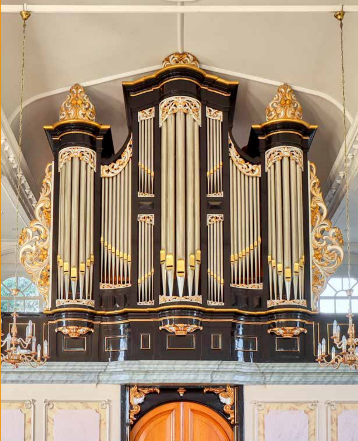
Het Willem Hardorff-orgel (1878) in de Hervormde Kerk van Baaium.