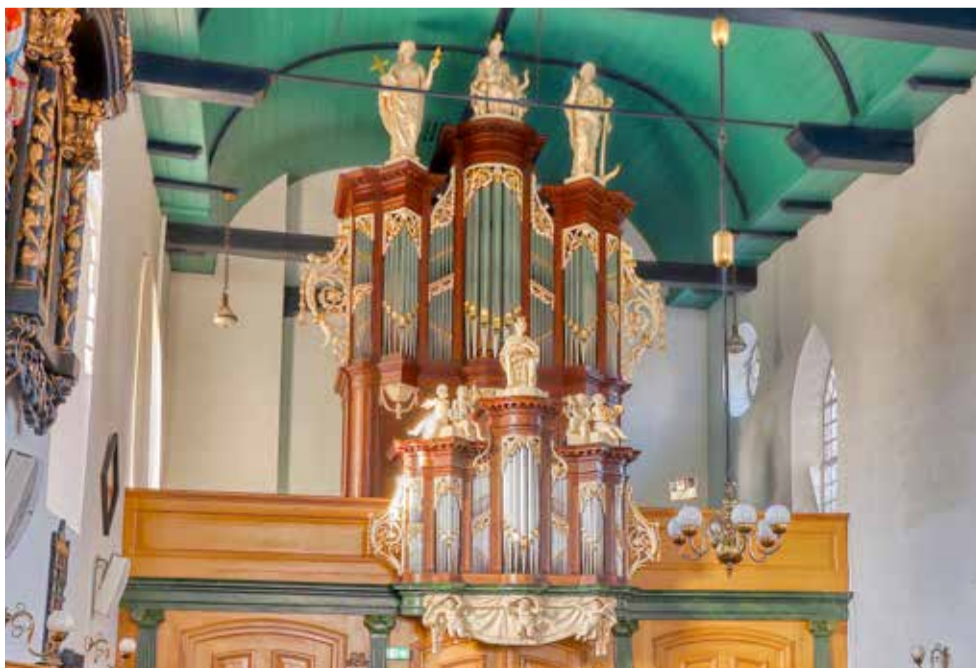
Het Albertus Johannes van Gruisen-orgel (1811) in de Maartenskerk van Hallum.

Via de Lauwersmeerweg gaan we richting Kollum en laten Kollumerpomp (Bakker & Timmenga, 1913) en Munnekezijl met zijn opus 174 uit 1920 van de Fa. Rohlfing uit Osnabrück even links liggen. Het voormalige orgel uit de Zijlsterkerk klinkt sinds 2021 in Terkaple. Dit orgel met een rococokast heeft al in meerdere regio's in ons land dienstgedaan. In Kollum steken twee kerktoeren boven het dorp uit. Beide kerken zijn mo-