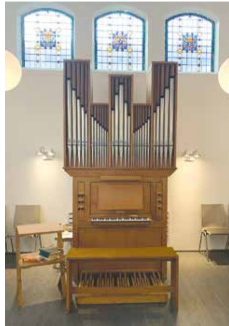
Het positief van Fama & Raadgever (1971) dat zich sinds 2017 in de oud-katholieke kerk van Groningen bevindt (6/II/aP).

Preek. Door de priester op basis van de gelezen gedeelten uit de Bijbel. De gemeente luistert zittend. Eventueel hierna een muzikaal interludium: orgelspel of orgelspel met zang of met andere instrumenten.