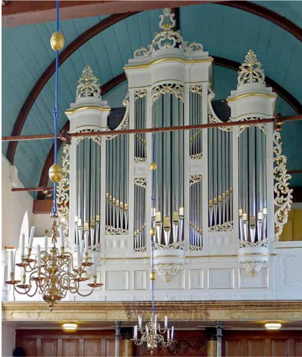
Het Hardorff-orgel (1867) in Easterlittens.

Het excursieseizoen wordt dit jaar iets later afgesloten dan gebruikelijk. Omdat we eind september altijd moeten concurreren met tal van andere culturele activiteiten, hebben we de excursie dit jaar twee weken later gepland op 10 oktober. De excursie voert ons naar Easterlittens, Baaium, Zweins en Tzum.