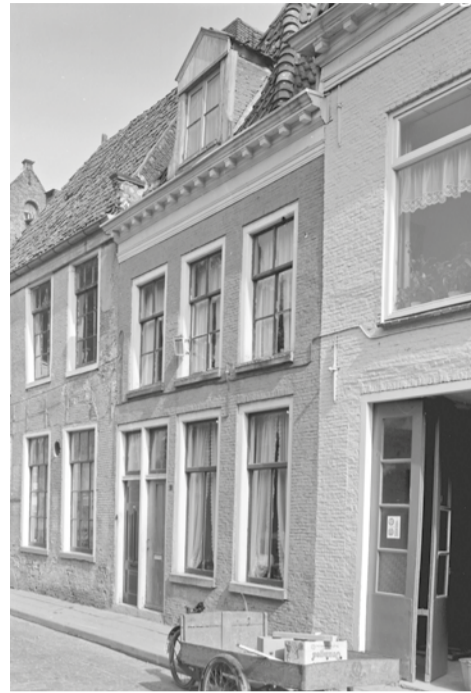
Kruisstraat 27 in de jaren vijftig.