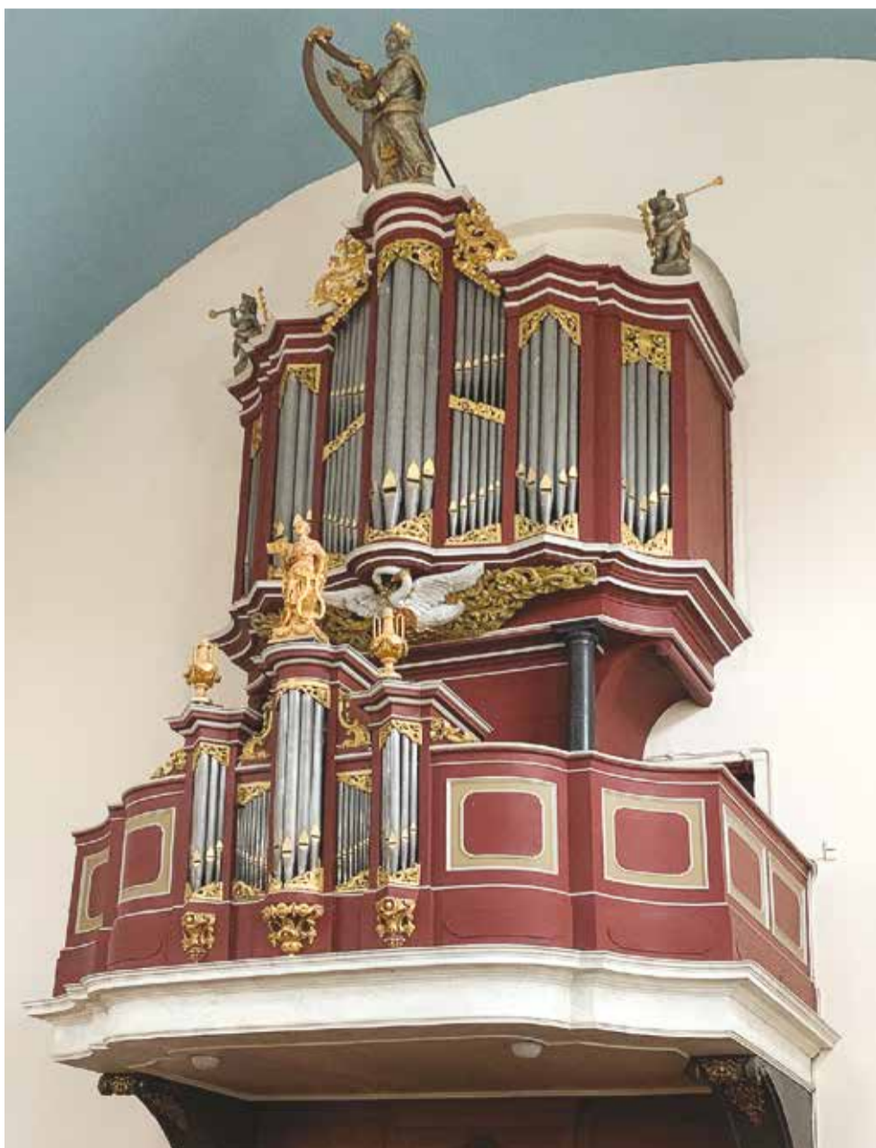
Front van het Duyschot-orgel (1707); in 1742 gewijzigd en geplaatst op huidige locatie. Daarna diverse keren gewijzigd. Hoofdorgel van de oudkatholieke kerk van de Heilige Augustinus te Middelburg (17/II/aP).