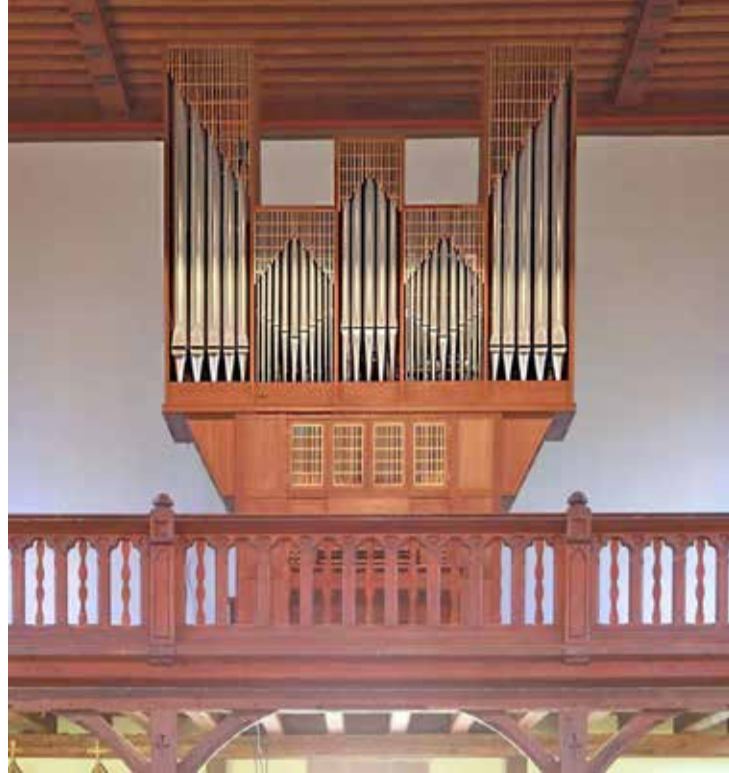
Het Bakker & Timmenga-orgel op de nieuwe locatie, de Église Saint-Gall van Niedersteinbach (Fr.).

Grote orgelrestauraties, waarin alle onderdelen en alle facetten van het instrument zijn betrokken, werden in 2025 in onze provincie niet voltooid. In het overzicht dat we begin 2025 presenteerden, werd melding gemaakt van de aanvang van twee zulke restauraties (in Goënga en in Pingjum). Die zullen in de loop van 2026 worden afgerond en in de krant van 2027 aandacht krijgen.