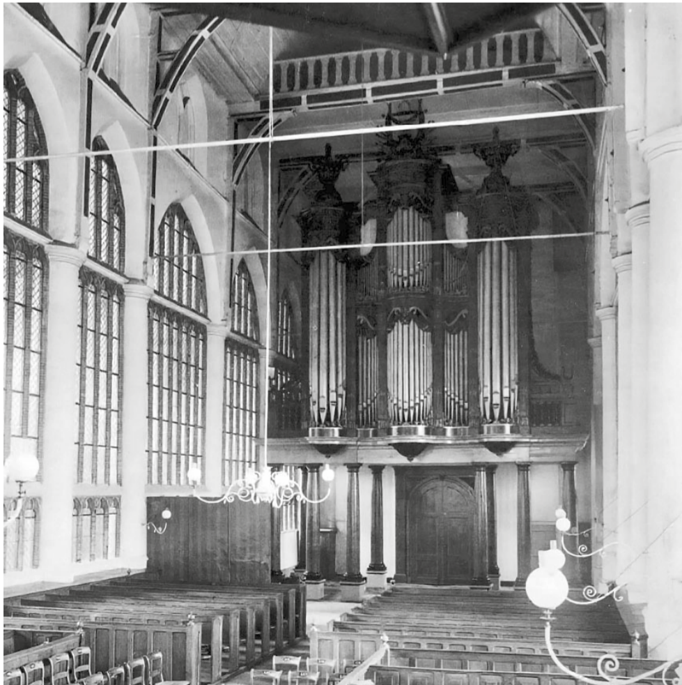
Het orgel in de Martinikerk te Franeker in de jaren dertig.