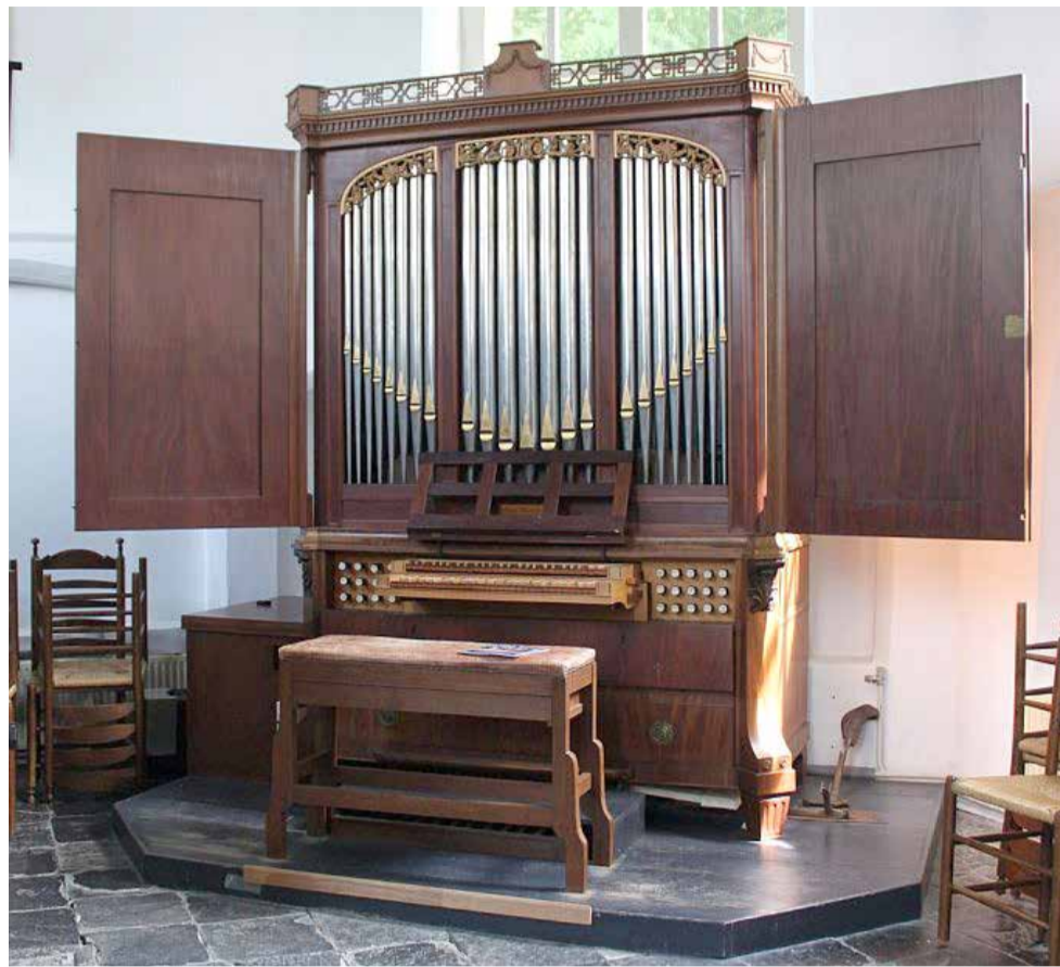
Het Meijer-kabinetorgel (1800) in de Stefanuskerk van Oldeholtpade.