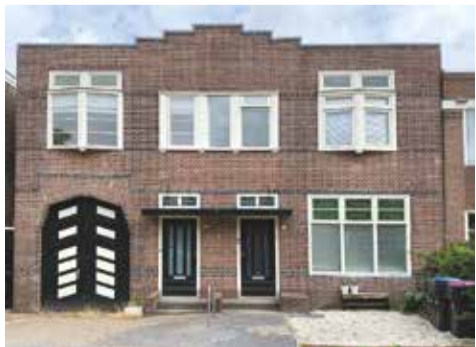
Garage met bovenwoning en met de woning ernaast, Lijsterstraat 28 en 28A. Perceel is nu gemeentelijk monument.