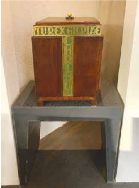
De (of ook wel het) tabernakel in de oud-katholieke kerk van Groningen. De tabernakel is het kastje waarin het geconsacreerde brood dat na een viering overblijft, wordt bewaard.

- Oudkatholieke opvattingen houden samen-gevat een streven naar een authentieke katholieke geloofstraditie in, die zich richt op de leer van de vroege kerk. Tegelijkertijd ademen zij openheid voor de moderne tijd, met een sterke nadruk op oecumene en persoonlijke geloofsbeleving. Aldus wordt een sterke historische oriëntatie gecombineerd met een open houding ten aanzien van hedendaagse maatschappelijke ontwikkelingen.