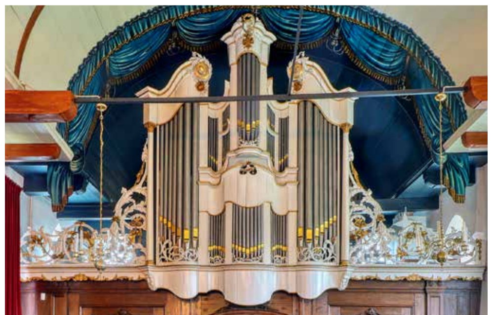
Front van het Knol-orgel (1788) in de Nederlandse Hervormde kerk, nu protestantse Nicolaaskerk, in Wieuwerd (Wiuwert).