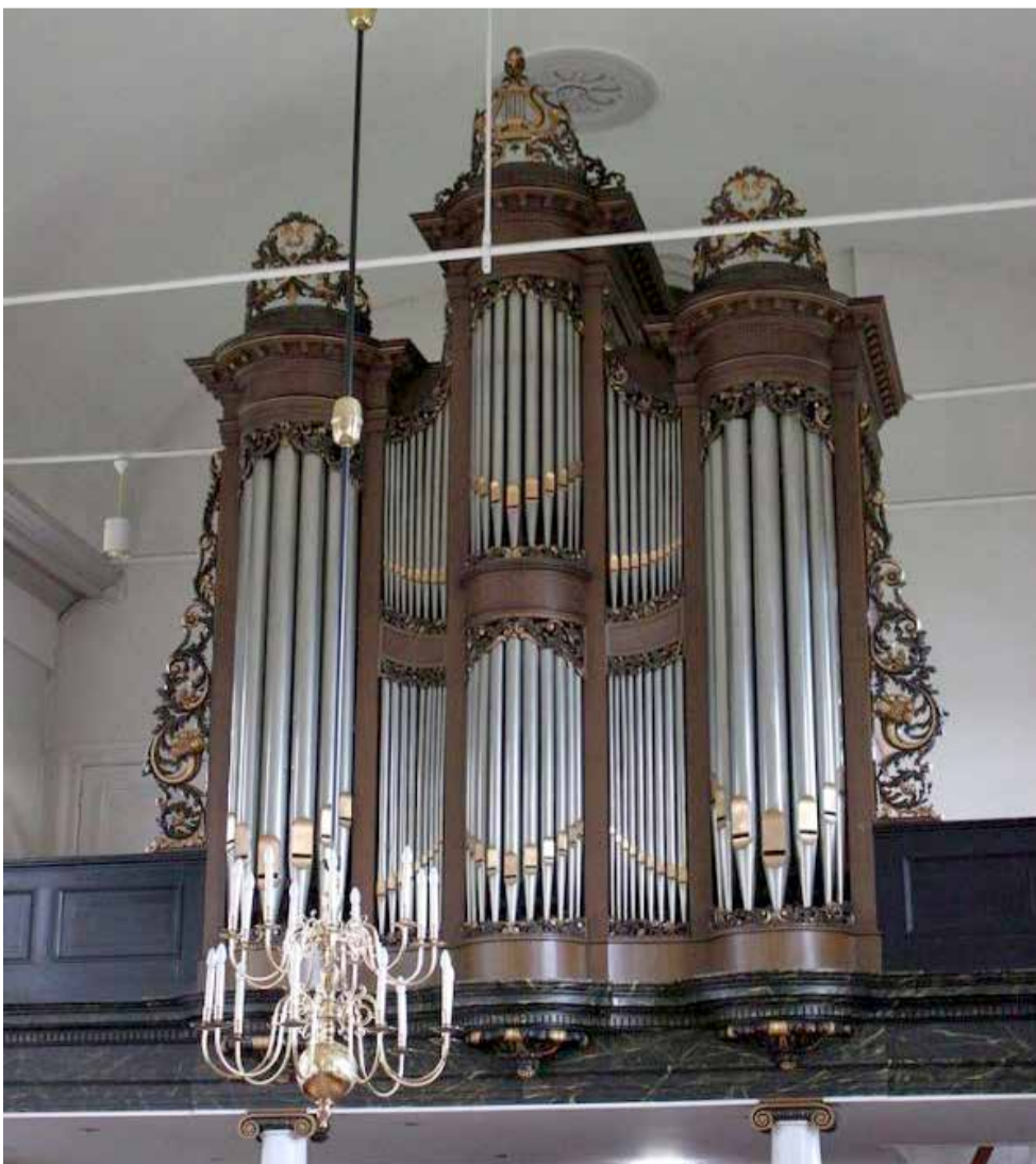
Het Hardorff-orgel (1862/63) in de Martenstsjerke van Scharnegoutum.

gel, waarin hij delen van het P.J. Radersma-orgel dat in de vorige kerk gestaan had, opnieuw gebruikte. Aan dit orgel is gewerkt door Valckx & Van Kouteren (1944), Pels (1962) en Vermeulen Alkmaar (1972). Al geruime tijd liet de conditie van het instrument te wensen over. Daarom is het in het voorbije jaar grondig onder handen geweest. De balgen zijn geheel gerestaureerd. Verbeteringen zijn uitgevoerd aan o.m. mechanieken, sleepafdichtingen, klaviatuur en intonatie. Aan de aanblik van het orgel aan de klaviatuurlaag is veel verbeterd door sanering van elektrische leidingen en door nieuwe bekleding in Hardorff-stijl van de orgelbank.