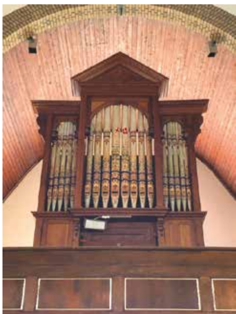
Front van het door August Gern gebouwde orgel (1872) in de oud-katholieke kerk van de Heilige Georgius te Amersfoort (13/III/vP).

Momenteel functioneren volgens de website https://oudkatholiek.nl/contact/parochies/ in de volgende 22 plaatsen nog actieve parochies: Alkmaar, Amersfoort, Amsterdam, Arnhem, Culemborg, Delft, Den Haag, Dordrecht, Egmond aan Zee, Eindhoven, Enkhuizen, Gouda, Groningen, Haarlem, Hilversum, IJmuiden, Krommenie, Leiden, Middelburg, Rotterdam, Schiedam en Utrecht. Daarnaast zijn er nog twee kern-groepen of staties: Mijdrecht en Twente/Hengelo.