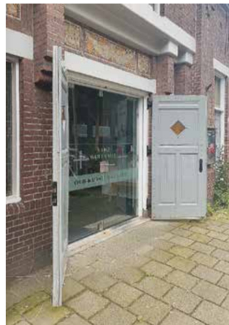
Ingang van de oud-katholieke kerk van de Heilige Martinus in de Witte de Withstraat te Groningen.

Vanaf 1806 stopte de oud-katholieke aanwezigheid in het noorden. In de 20e eeuw kwam er weer een groep oud-katholieken af en toe bijeen in de stad Groningen. Na incidenteel diensten te hebben gehouden op verschillende locaties werd negen jaar in het 13e eeuwse kerkje van Engelbert gekerkt. Uiteindelijk trok de oud-katholieke parochie in 2011 in de stad Groningen een pand in de Witte de Withstraat aan dat oorspronkelijk in 1917 gebouwd werd voor de katholieke-apostolische gemeente. Na een grondige verbouwing kon de oud-katholieke parochie begin 2014 het pand als kerk (van de Heilige Martinus) in gebruik nemen. De Groninger oud-katholieken hebben nu na enkele decennia 'zwerfen' dus een eigen plek. Op de oneven zondagen van de maand houden zij er hun vieringen. Een positief uit 1971 gebouwd door Fama & Raadgever werd in 2017 door de orgelmakerij Mense Ruiters in de kerk geplaatst. De anglicaanse kerkgemeenschap gebruikt het kerkgebouw op de even zondagen.