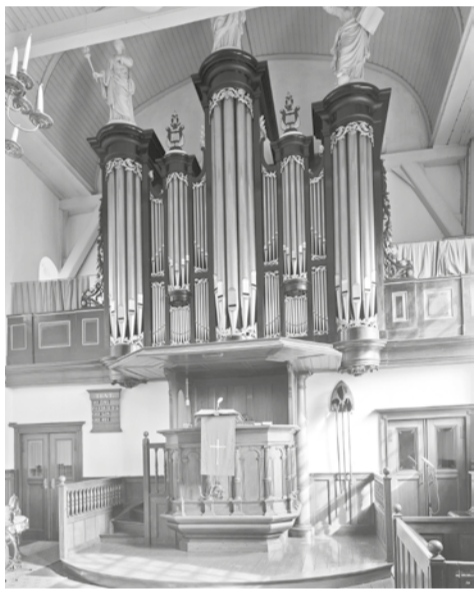
Het orgel van Grou voor de restauratie van de kerk.