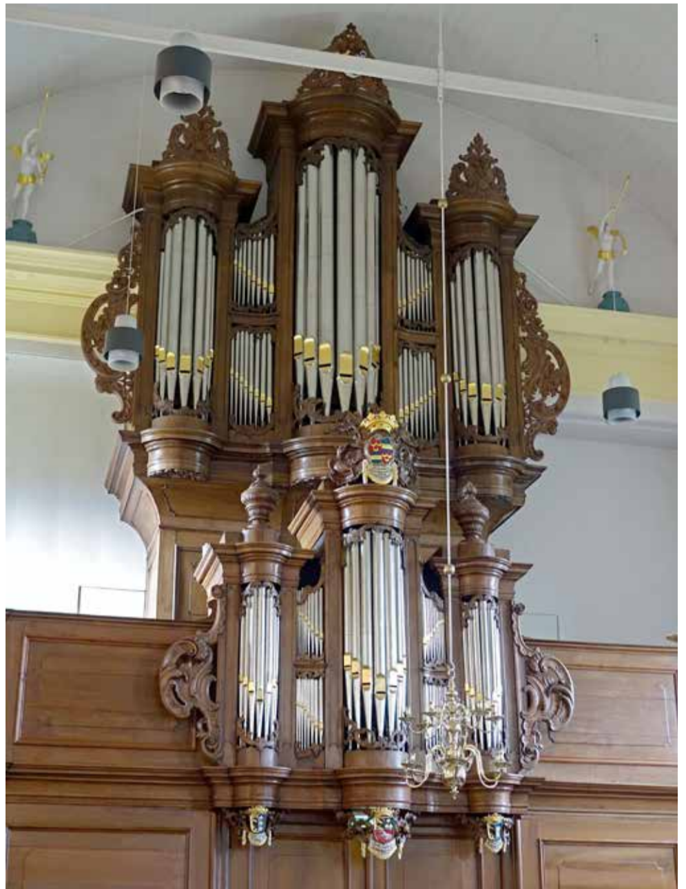
Het Stevens/Hinsz-orgel (1760/1764) in Tzum.