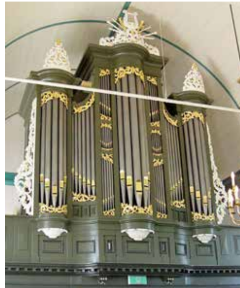
Front van het Van Dam-orgel (1864) in de Agneskerk te Goutum, zomer 2025.

De beide windladen werden gerestaureerd en verder vond technisch onderhoud en herstel plaats. Het instrument bleef ongewijzigd. Het pijpwerk werd bij het herplaatsen nage- lopen op intonatiegrekken maar niet gher-