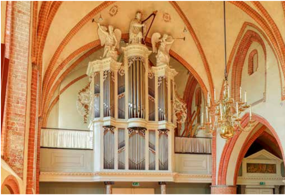
Het Van Gruisen-orgel (1841) in de Maartenskerk van Kollum.