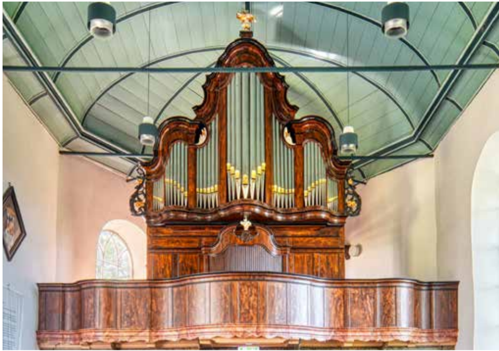
Het Wenthin-orgel (1785) in Zweins.