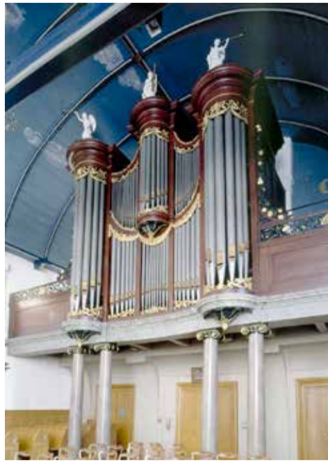
Het Dirk Sjoerds Ypma-orgel (1842) in Lemmer.

De kerkruimte wordt overdekt door een fraai, houten tongewelf. Tijdens de kerkrestauratie in 1984 komt de oorspronkelijke beschilder-