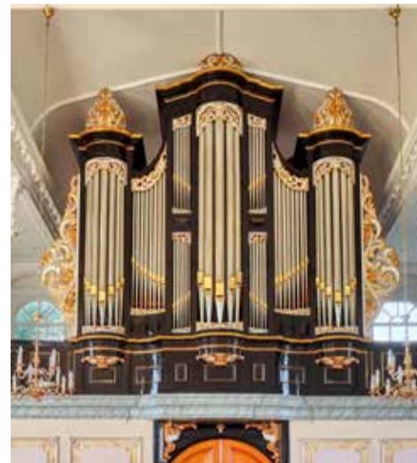
Het Hardorff-orgel (1878) in Baaium.