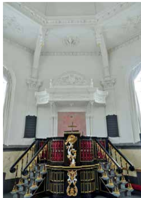
De zeer bijzondere en rijk versierde kansel in Baaium.

Met name het interieur is bijzonder rijk versierd in een eclectische stijl: maniërisme, barok, rococo, (neo-)classicisme en eigen inbreng van de architect (S. van Veen) komen langs. Naast de lambrisering met imitatiemarmor en de twee met baldakijnen overhuifde kerkenraadsbanken, is ook de kansel de moeite waard. Het is een verbluffend spreekgestoelte met trapjes aan weerskanten, holle en bolle welvingen, gestucte cartouche met engelen tegen het plafond van het klankbord en de veelheid aan andere