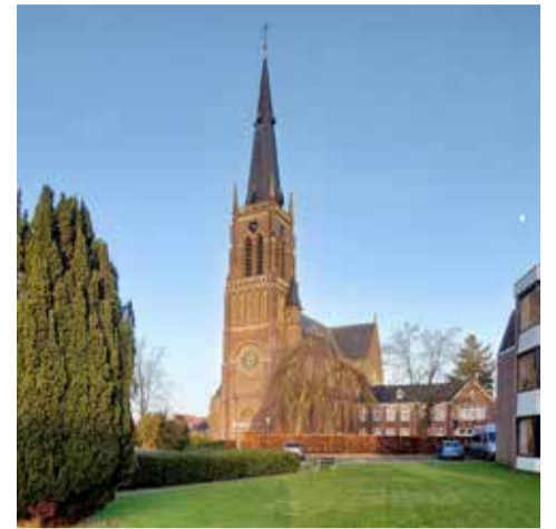
De Sint-Nicolaaskerk met haar hoge toren die van heinde en verre is te zien.